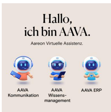
Aareon führt die KI-Assistenz AAVA in den Themenfeldern Kommunikation, Wissensmanagement und ERP ein.